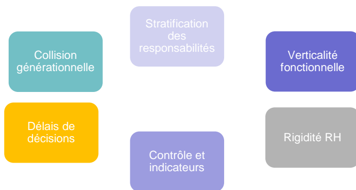
Les contraintes d'une grande entreprise